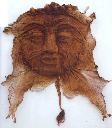
Cowskin Buddha Face No.9牛皮佛脸9号_190cm x 163cm x 42cm_Cowskin牛皮_2010